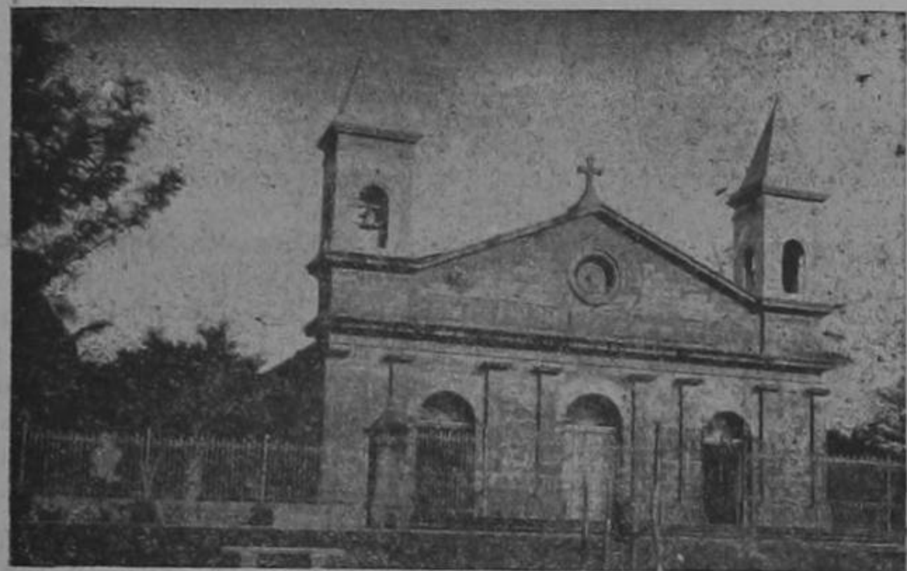
Iglesia Parroquial de San Joaquín de Flores